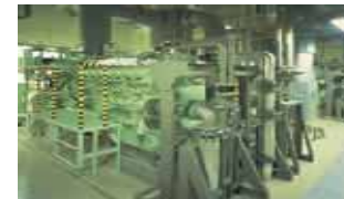
1,000kWクラス ガスエンジン発電設備